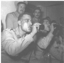
جمال عبد الناصر وعبد الحكيم عامر